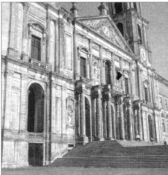
Foto do Convento de Mafra, tirada em 1969. A larga escadaria conduz à entrada do Palácio e Mosteiro de Mafra, erguido em 1716 e 1735.

(In: Gislane Azevedo e Reinado Seriacopi. História . São Paulo: Ática, 2005, p. 276 [Serie Brasil])